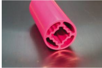
Vibrationsdämpfende Spezialhülse für die verschiedenen Schleifräder wie Mop-Rad, Mix-Rad, Vlies-Rad etc.